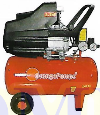
CLAVE (0908) SGBM24L

USA ACEITE MONOGRADO SAE30/ISO100 250 ML