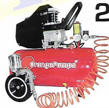
CLAVE (0909K) SGBM50L-KIT

Accesorios Incluidos Manguera de 5 Metros de largo Pistola de gravedad 400ml