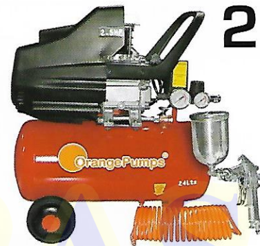
CLAVE (0908K) SGBM24L-KIT

Accesorios Incluidos Manguera de 5 Metros de largo Pistola de gravedad 400ml