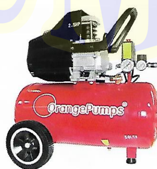
CLAVE (0909) SGBM50L

USA ACEITE MONOGRADO SAE30/ISO100 250 ML