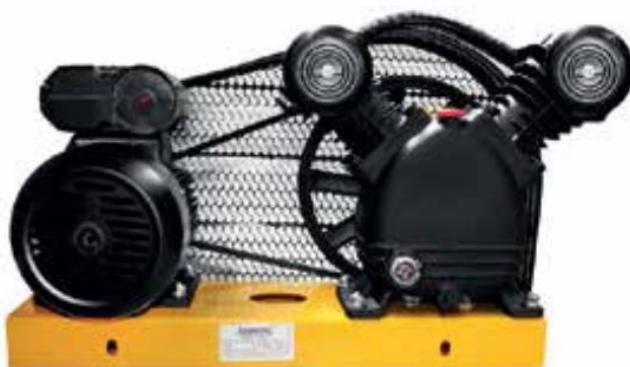
SG2051 Clave 0932