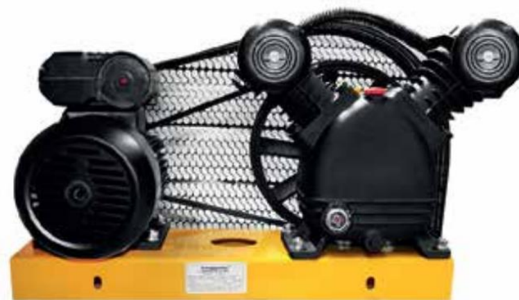
SG2065 Clave 0933