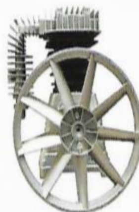
Clave: (9285) DH2090-AL 5 HP