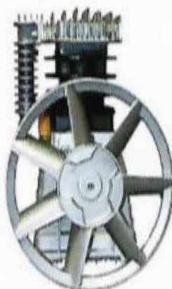
Clave: (9282) DHA2055-AL 2 HP Clave: (9283) DHD2065-AL 3 HP