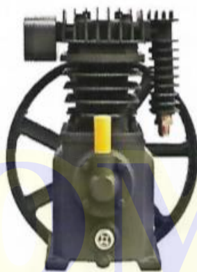
Clave: (9221) DHD2065 3 HP